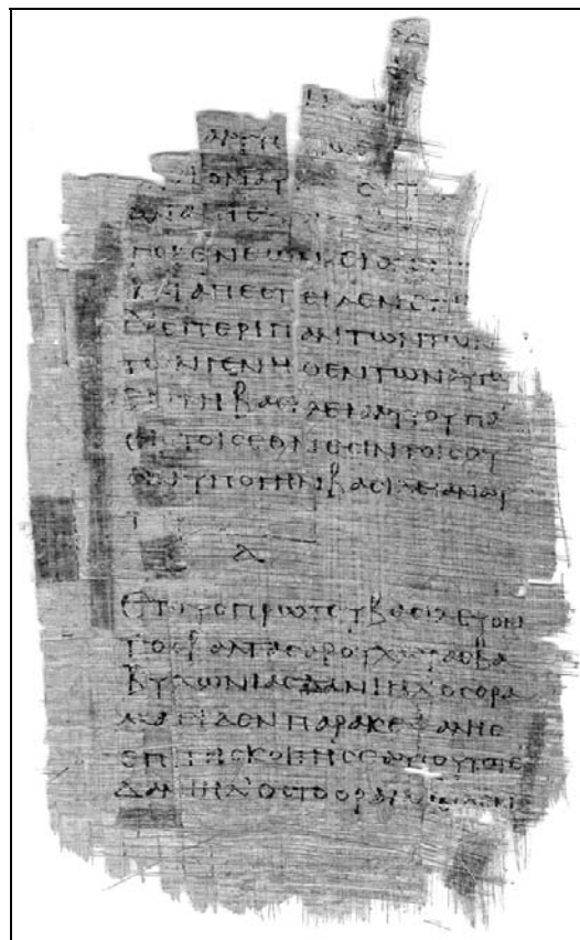
Abb. 4: p967 – Blatt 22 recto, Seite 151; Daniel 4,34c (37) – 7,1.

Allerdings fehlt die Ziffer „1“. Zwischen erstem und zweitem Kapitel schließt der Text unmittelbar an (siehe Abb. 1). Offensichtlich vergaß der Schreiber beim ersten Kapitel, eine Ziffer einzufügen, aber dann erfolgt eine regelmäßige Nummerierung, und zwar beginnend mit „2“ (Beta). Zwischen c. 2 und 3 steht ein Beta (siehe Abb. 3), zwischen c. 3 und 4 Gamma, nach c. 4 ein Delta (siehe Abb. 4) usw. Leider sind die Ziffern nur bis zum Ende von c. 10 erhalten. Bei den weiteren Kapiteln ist ausgerechnet das jeweilige Kapitelende nicht erhalten. – Haben wir nun mit diesen Ziffern die Anfänge der Kapitelzählung vor uns, immerhin tausend Jahre vor Langton? Gewiss ist, dass die ganze Frage der Abschnittgliederung in den biblischen Schriften differenzierter zu untersuchen ist und dass es eine lange Entwicklung der Paragraphen- und der Abschnittgliederung gibt, und auch, dass die Kapiteleinteilung offensichtlich eine Vorgeschichte hat. Auffallend ist aber auch, dass innerhalb desselben Papyrus, wenn auch verteilt auf unterschiedliche Schreiberhände, Daniel eine Zählung hat, während Ezechiel keine Zählung hat.