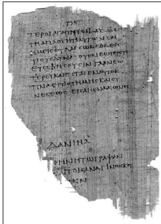
Abb. 2: p967 – Blatt 37 verso, Seite 196; Susanna 62a–b + Subscriptio „Daniel“.

zu einem Problem führte. Viele Seiten sind in der Mitte auseinandergerissen (siehe z. B. Abb. 2). Möglicherweise geht das nicht auf absichtliche Beschädigung zurück, sondern auf unsachgemäße, zu starke Einschnürung in einem Bündel von Papyri, wobei die Schnur im Lauf der Zeit viele Seiten durchtrennte.